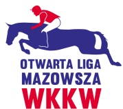
TABELA RANKINGOWA – 2015 OTWARTEJ LIGI MAZOWSZA W WKKW PO II ELIMINACJI Rozegranej 20-21.06.2015 r. w SO Bogusławice